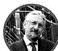
MASSIMO TAVOLA SECONDARIA DI PRIMO GRADO