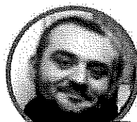
ROBERTO ZOLLO SCUOLA PRIMARIA