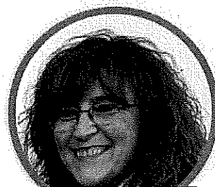
MARIANGELA MAPELLI SCUOLA PRIMARIA