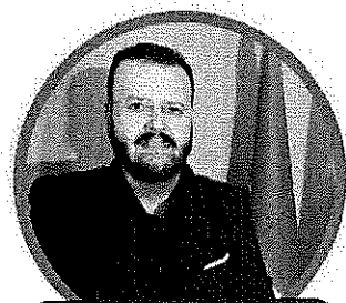
GIUSEPPE FAVILLA SECONDARIA DI SECONDO GRADO

DOCENTI, ATA, INSEGNANTI DI RELIGIONE PER LA SCUOLA